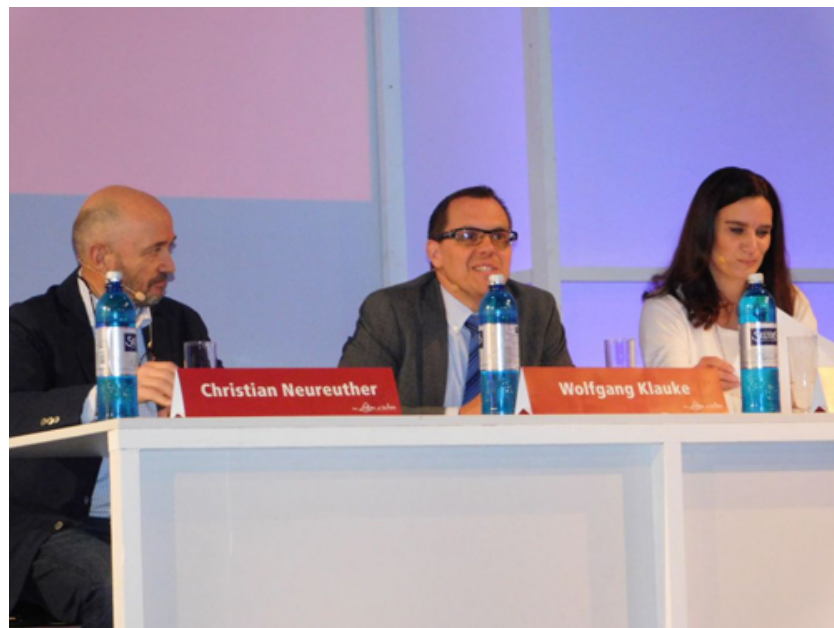
Christian Neureuther in der Pressekonferenz bei der EVO ***

(19.05.16) Es soll ein berauschendes Fest werden, das am 26. November als Galapremiere in der Fredenhagen-Halle in der Sprendlinger Landstraße in Offenbach startet. „Das Leben ist schön“ heißt die Veranstaltungsreihe, die erstmalig dort zur Adventszeit die Besucher in eine Welt voll Akrobatik, Genuss, Musik und Illusion entführen will. Es ist nicht nur „eine neue, sondern auch eine neuartige Premium-Event-Reihe“ so die Veranstalter, die Veranstaltungsagent CIRCIE8 aus Groß-Gerau, die jährlich über 1500 Veranstaltungen weltweit ausrichtet. Das Offenbacher Event-Projekt unterstützt die Deutsche Kinderreuma-Stiftung bei der Aufklärung rund um das Thema sowie gezielte Aktionen und Spenden. Als Botschafter der Stiftung fungieren der Skiläufer Christian Neureuther und die Olympiasiegerin Rosi Mittermaier, beide waren auch für die Pressekonferenz in Offenbach in der alten Schlosserei der EVO angekündigt, doch die Olympiasiegerin musste sich wegen eines Krankenhausaufenthaltes entschuldigen und übermittelte ihre Grüße in einer kurzen Video-Botschaft vom Krankenbett.