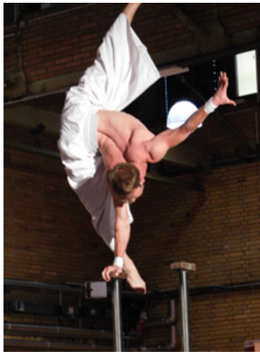
Auch Künstler und Artisten gestalten das Programm ***